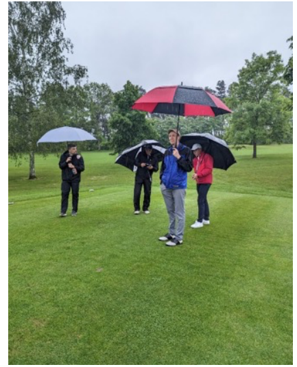
Am Vortag war kaum Hoffnung auf Spielbarkeit für den Samstag angesagt ...